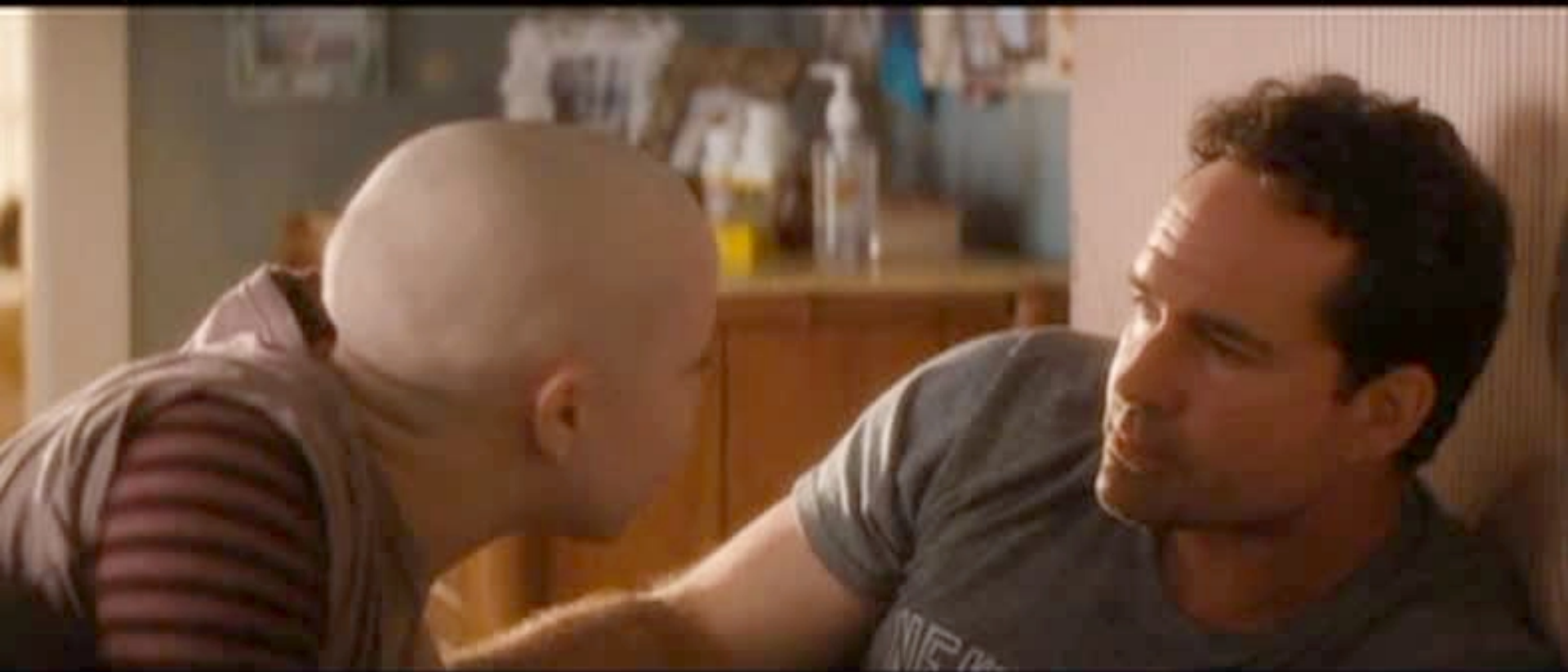
IMMAGINE di SE' ...